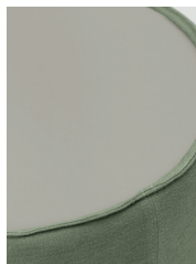
laccato ral / ral laquered