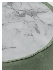
marmo / marble