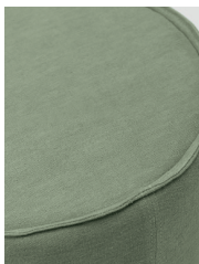
tessuto coordinato / coordinated fabric