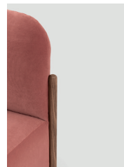
gamba base basic leg