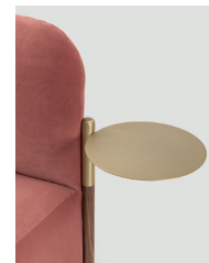
tappo + vassoio cap + tray